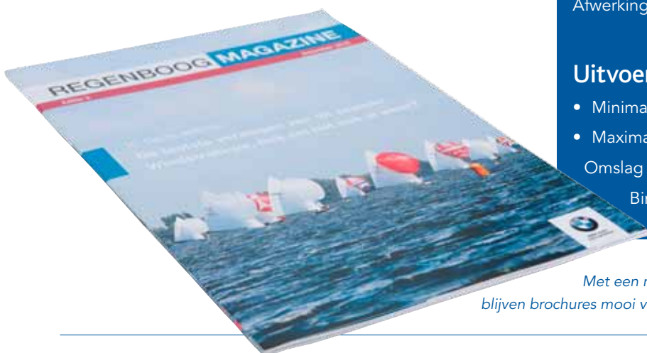
Met een rechte rug blijven brochures mooi vlak liggen

■ Bij het brocheren van magazines worden omslag en binnenwerk gevouwen en in de rug geniet. Dat doen we al heel lang bij Scan Laser, daar zijn we zeer ervaren in. Tegenwoordig kunnen we ook squarefold geniet brochures. Dat is een dubbele vouw met nietjes waardoor een rechte rug ontstaat. Dit geeft een strak resultaat met een exclusief uiterlijk. Voordeel is dat de boekjes goed dicht blijven liggen en probleemloos gestapeld kunnen worden. Squarefold wordt zonder meerkosten toegepast. ■