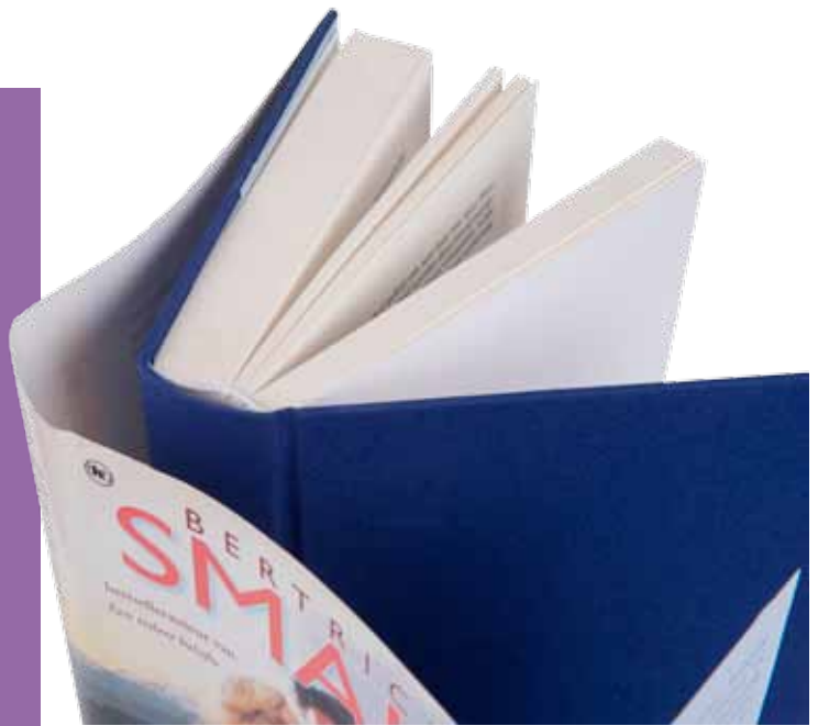
Hardcover linnen kaft met stofomslag

Papier Keuze uit diverse papiersoorten, zwaardere MC-soorten ook mogelijk