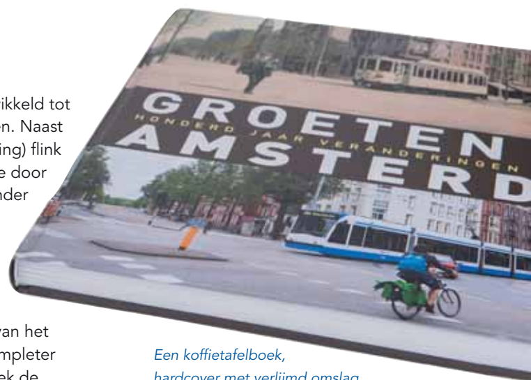
Een koffietafelboek, hardcover met verlijmd omslag

■ Scan Laser heeft zich het laatste jaar in een razend tempo ontwikkeld tot een nog completere producent van boeken en informatieproducten. Naast Printing on Demand zijn onze mogelijkheden met finishing (afwerking) flink toegenomen en kunnen wij u meer bieden. Dat komt onder andere door de overname van de activiteiten van een gerenommeerde boekbinder vorig jaar. We hebben toen niet alleen apparatuur overgenomen, maar ook de jarenlange kennis en ervaring van medewerkers. Het goed afwerken van boeken is vakwerk. Tegenwoordig is dat ook ons vak. Alle boekproducties vinden plaats in dezelfde productieruimte. Dat biedt legio voordelen, in snelheid, kwaliteit en betrouwbaarheid. Maar minstens zo belangrijk, op het gebied van het afwerken van boeken kunnen we nu alles aan. Daardoor zijn wij completer en beter in finishing. Zelfs in oplage één hebben wij voor ieder boek de gewenste finishing. ■